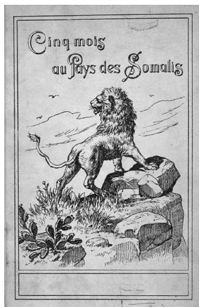
Fig. nr. 2 – Prințul Nicolae D. Ghika și lucrarea sa Cinq mois au pays des Somalis

Imaginile evidențiază explorarea în folosul științei, talentul de vânător, inteligența scilpitoare, spiritul de aventură și de mare curaj pe care prinții Ghika, tată și fiu, le-au dovedit explorând teritorii africane pline de pericole, zone puțin cunoscute sau chiar necunoscute la acea dată.